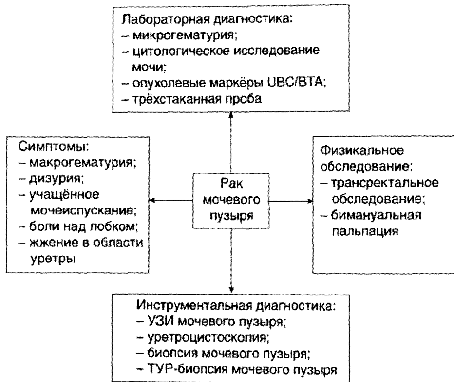
Рисунок 2. Схема уточняющей диагностики рака мочевого пузыря