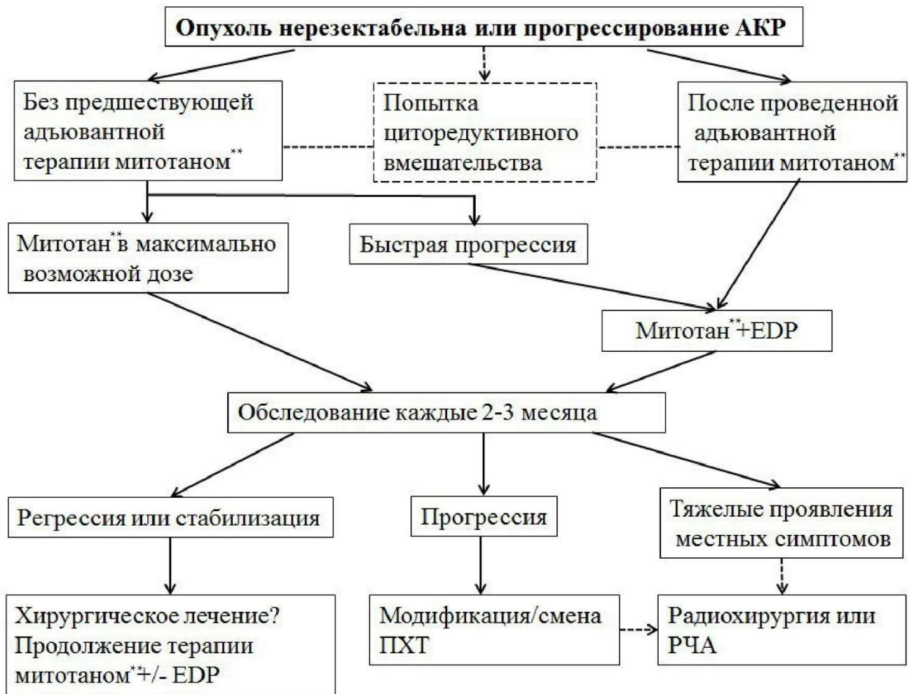
Рисунок 2. Алгоритм лечения при нерезектабельном или прогрессирующем АКР