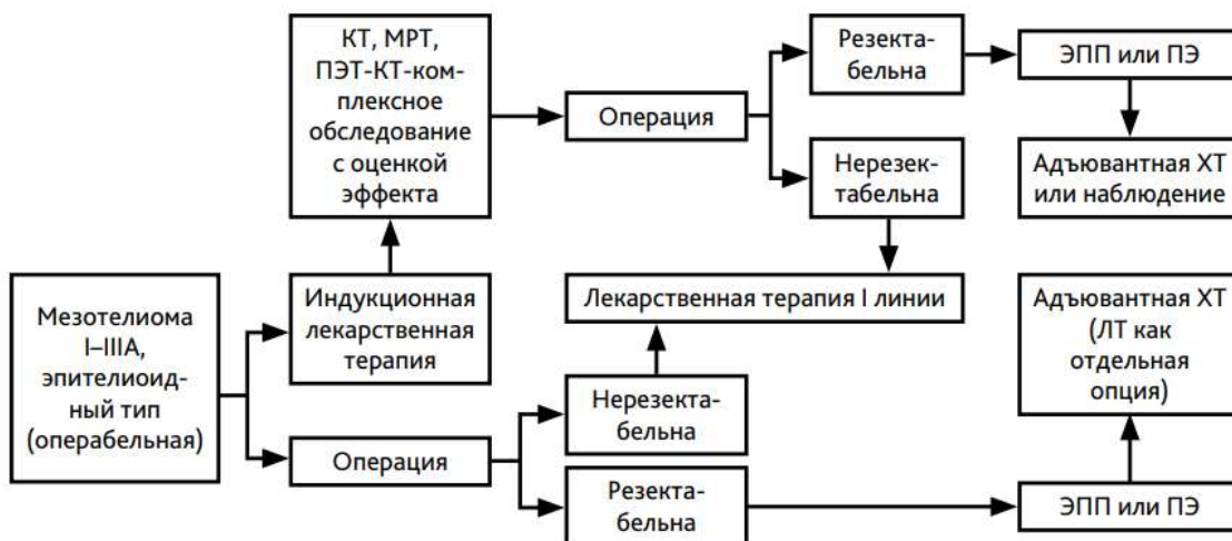
Рис. 2. Алгоритм лечения локализованной мезотелиомы плевры