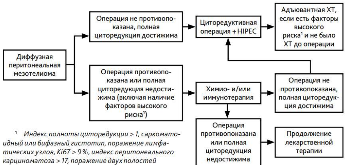
Рис. 4. Алгоритм лечения диффузной перитонеальной мезотелиомы