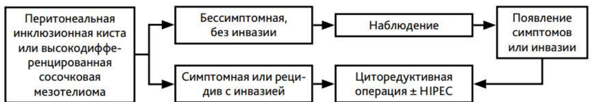
Рис. 5. Алгоритм лечения перитонеальной инклюзионной кисты или высококодифференцированной сосочковой мезотелиомы