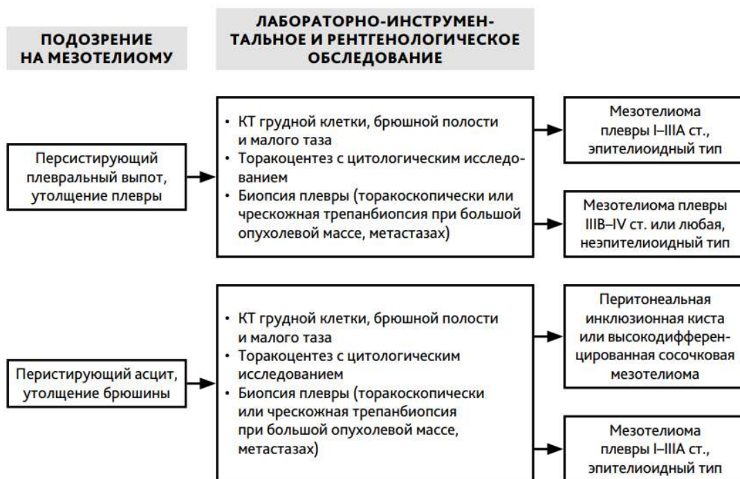
Рис. 1. Алгоритм первичной диагностики при подозрении на мезотелиому