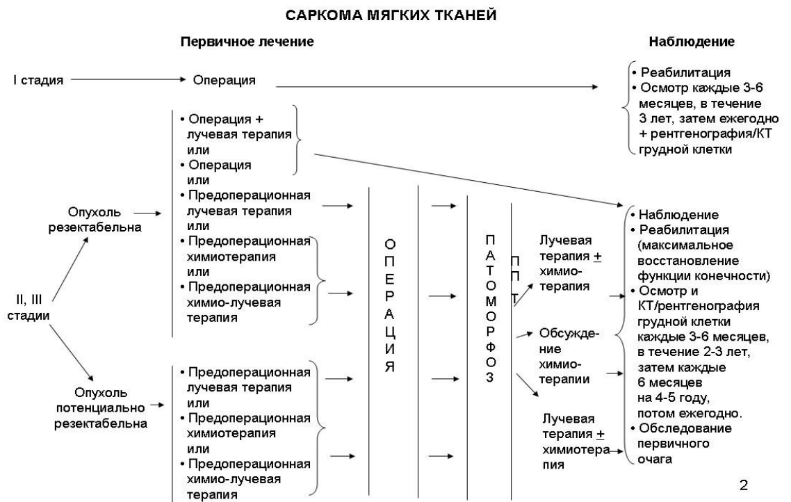
Схема 1. Блок-схема диагностики и лечения пациентов с саркомами мягких тканей