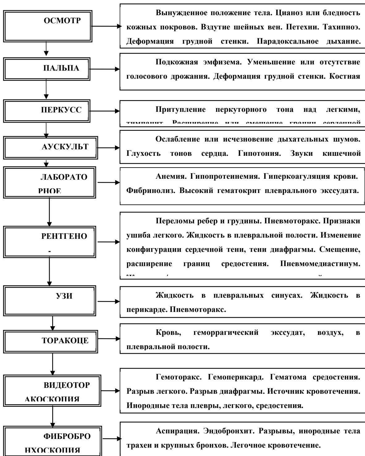
Алгоритм диагностики при закрытой травме груди [45, 143]